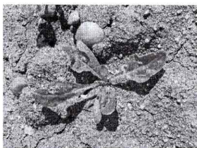
atac de pureci

Adultii hibernanti apar primavara la sfarsitul lunii martie, inceputul luni aprilie cand in sol la 5 cm adancime se mentine timp de mai multe zile o temperatura constanta de 5°C. Dupa aparitie adultii incep sa se hraneasca pe diferite specii spontane dupa care trec in culturile de sfecla abia rasarite, unde isi continua hranirea. Acestia ataca frunzele de regula pe partea inferioara, unde produc mici orificii sub forma de ciuruire. Uneori rod si petiolul.