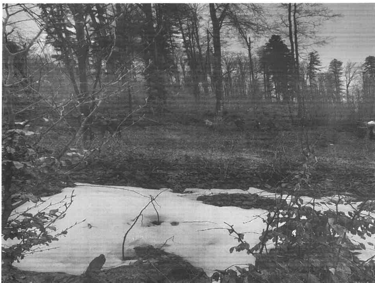
Foto: Șantier de împăduriri

strângerea pietrelor, bolovanilor; înlăturarea vegetației erbacee parțial sau de pe întreaga suprafață.