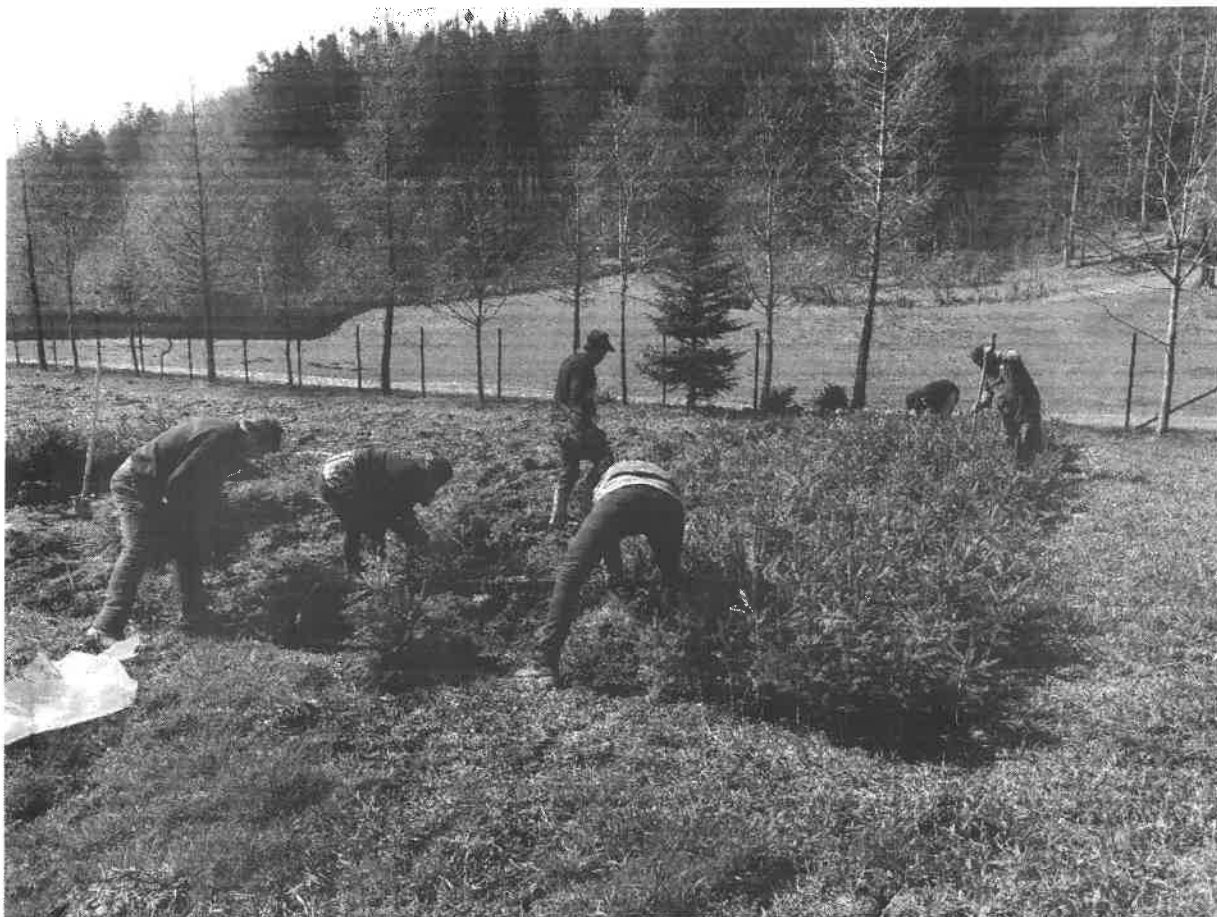
Foto: Puieti forestieri destinați împăduririi