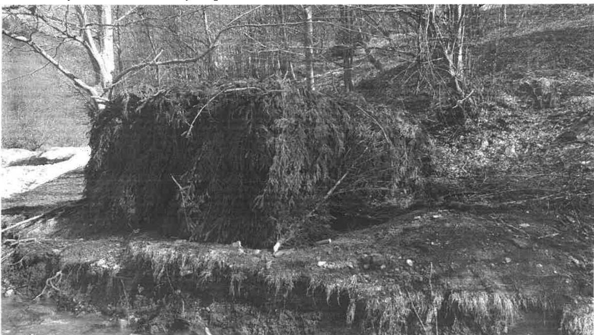
Foto: Ghețar pentru păstrarea puietilor